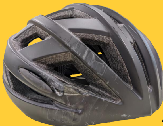
Aさんの命を守ったヘルメット

都立高校生のAさんは、自転車で下校中に転倒し、頭部を強く打ちましたが、ヘルメットを着用していたため、大きな怪我にはつながりませんでした。