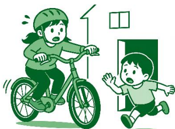
▶ 道路に面した住宅等からの飛び出し