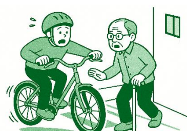
▶ 信号のない交差点等での横断

事例のような歩行者との事故を未然に防ぐためには、交通ルールを遵守させるとともに、生徒一人一人の「危険を予測し回避する能力」を高めていく必要があります。「 安全教育プログラム（第17集 増補版） 」に掲載されている指導事例等を参考に、学校周辺で事故が起こりやすい箇所を生徒と確認する取組を実施するなど、効果的な交通安全教育の実施をお願いいたします。併せて、 自転車通学者の保険加入状況 については、 毎年度、全学年を対象に確認 していただきますよう御協力をお願いいたします。