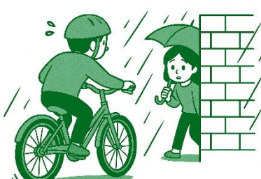
▶ 見通しの悪い路地